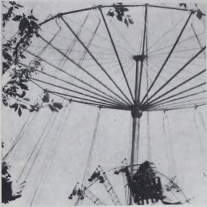
В городском парке.

Можно сказать с уверенностью, что ДК «Зодчий» внесет свой сильный вклад в дело организации хорошего летнего отдыха трудящихся нашего орденоносного города.