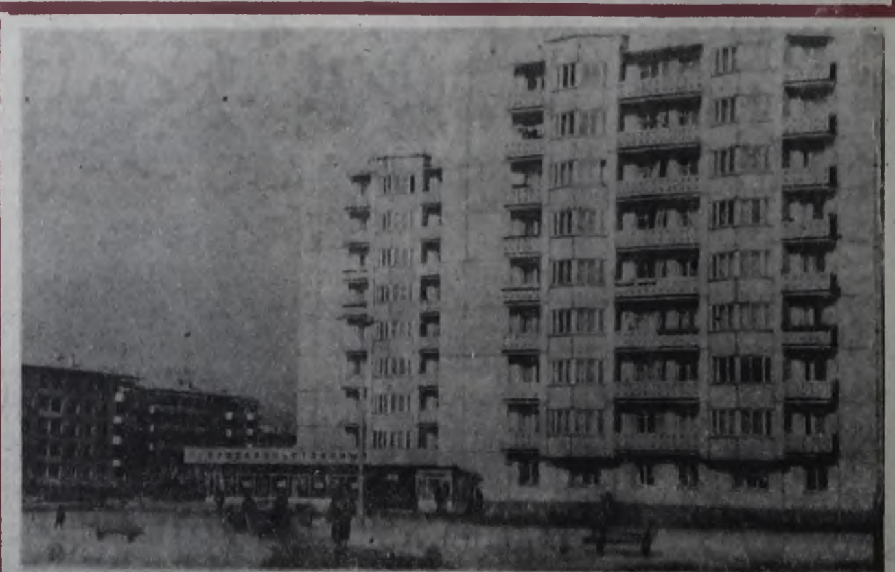
«Девятиэтажка» 15 микрорайона.