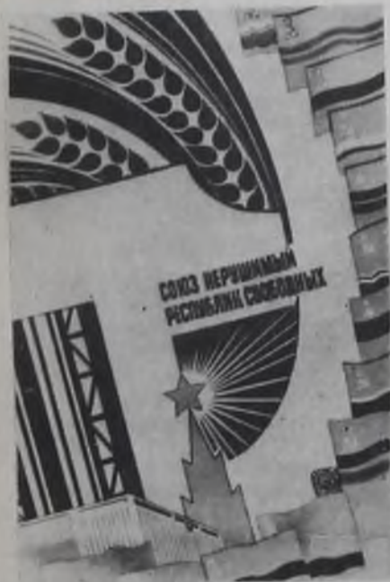
Плакат художника В. Механ'tсева. Издательство «Плакат».

А. ТЕЛЕБА, ветеран труда, наш внешт. корр.