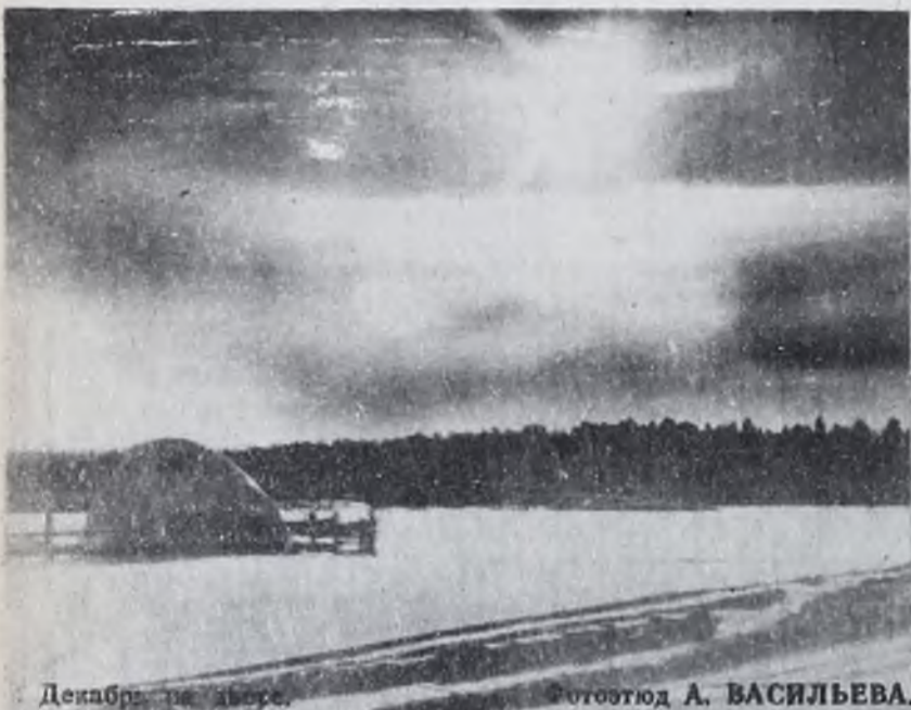
Декабрь на Ангаре.

Обращаться по адресу: 86-15-24. Справки по телефону: 2-36-65 с 9.00 до 18 часов.