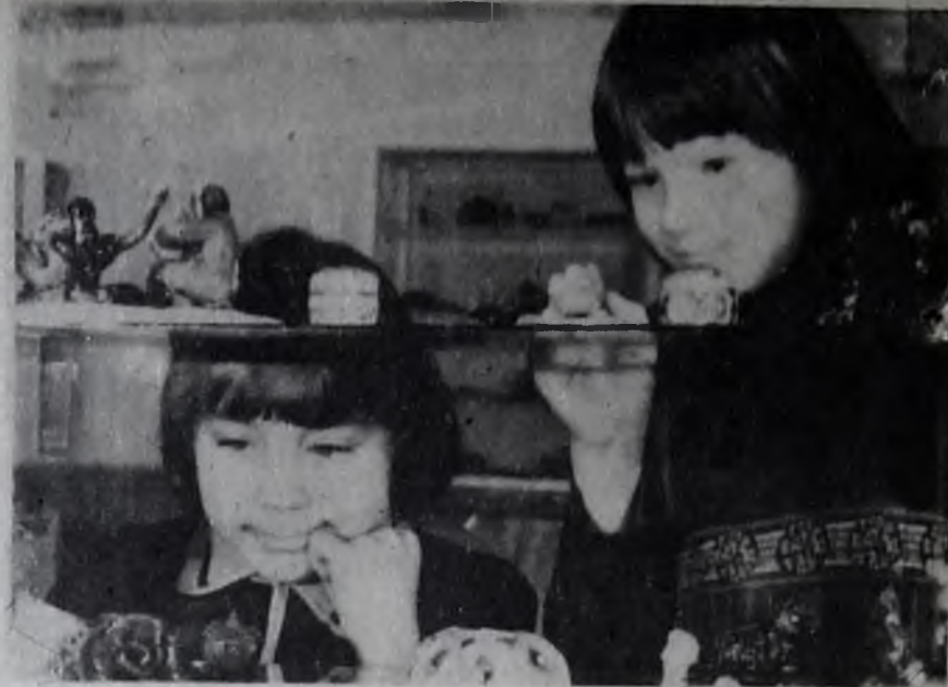
На выставке декоративно-прикладного искусства в детской школе искусств поселка Палана (Корякский автономный округ).