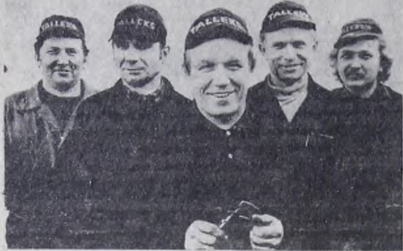
ЭСТОНСКАЯ ССР — В СЕМЬЕ ЕДИНОЙ

Производственное объединение «Таллэкс» — головное предприятие системы СЭВ по выпуску дренажных экскаваторов. Здесь производят каждую четвертую машину в мире. Они поставляются во все республики нашей страны и в 20 зарубежных государств.