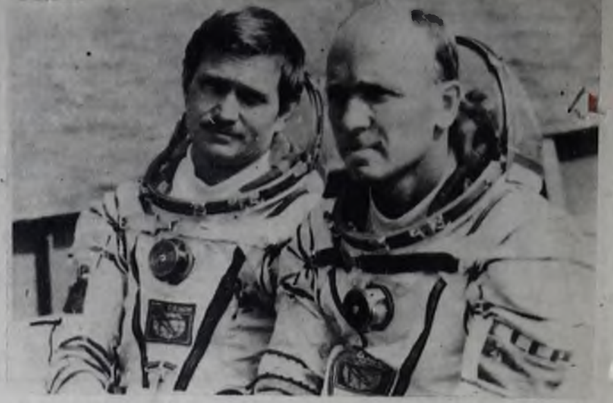
Экипаж космического корабля «Союз Т-5» — командир корабля подполковник Анатолий Николаевич Березовой (слева) и бортинженер летчик-космонавт СССР, Герой Советского Союза Валентин Витальевич Лебедев. Снимок сделан во время тренировки на море.

Отмечая положительную работу шефов по выполнению производственных планов, предупреждению травматизма и укреплению трудовой дисциплины, идеологическая планерка, в частности, рекомендует начальникам подразделений взять под свой контроль работу шефов над бригадами, руководить и направлять ее согласно постановлению парткома, руководства АУС и группкома от 19 июня 1979 года, в июне шефам провести в своих бригадах собрания с обсуждением вопросов состояния трудовой дисциплины, охраны труда и техники безопасности.