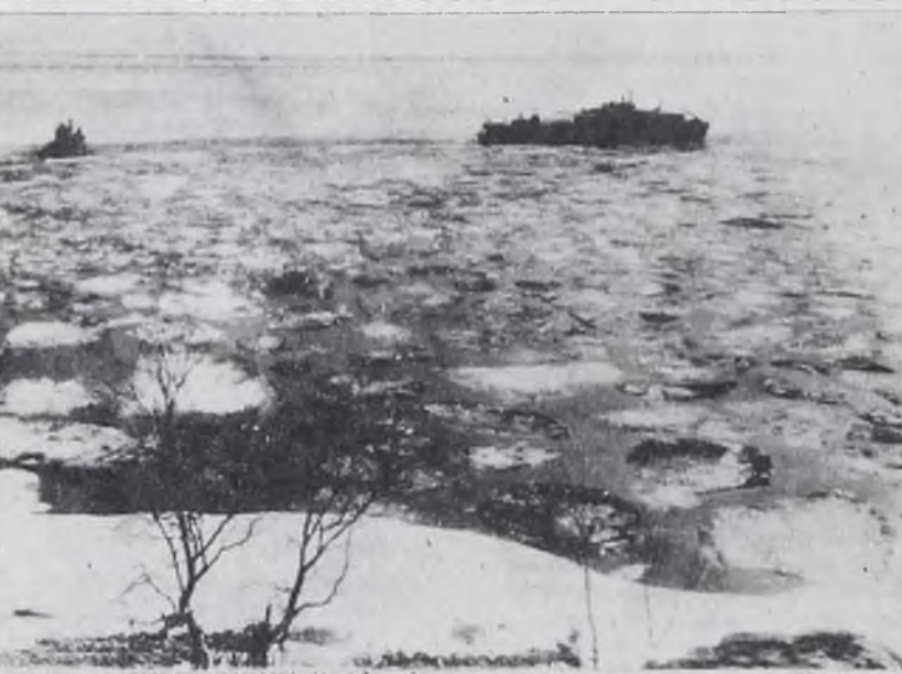
ВЕСНА НА БАЙКАЛЕ.

28 апреля — Штормовое предупреждение. 12, 14, 16, 18, 19-30 (удл.), 21-40. Мультисборник «Трое из Простоквашино». 29—30 апреля — Штормовое предупреждение. 12, 16, 18, 19-30 (удл.), 21-40. Мультисборник «Шарики-взрывки». 10, 14.