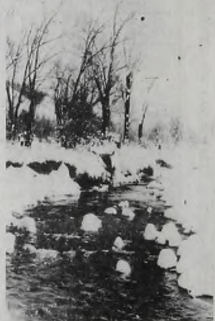
ДЫХАНИЕ ВЕСНЫ, Фото Е. ЧЕБОТАРЕВА.

ЗНАМЕНИТУЮ Пизавскую башню, или, как ее еще называют, кампанилу, начали строить в 1173 году, а завершили строительство в 1350 году. И вот тогда-то и случилось то, что сделало кампанилу знаменитой: произошла осадка грунта, и башня наклонилась. Дополнительная осадка повторилась. И в тех пор башня привлекает к себе внимание не только итальянцев. Регулярно измеряются отклонения от вертикали. По данным за 1980 год, отклонение увеличилось на 1,2—1,3 миллиметра и сейчас составляет у верхушки башни (на высоте 54 метра) 5,10 метра. Но сколько ей еще наклоняться до падения — сказать невозможно.