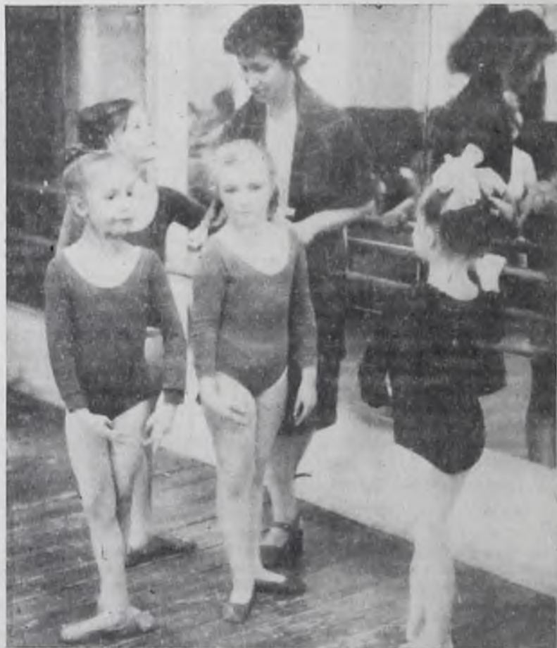
Идет репетиция в детской хореографической студии ДК «Строитель».

ная курица, или Подземные жители. 10-15, 12-15, 14-15, 16-15. 15—16 февраля — Роковое путешествие (2 серии). 10, 13, 16, 18-40, 21-10.