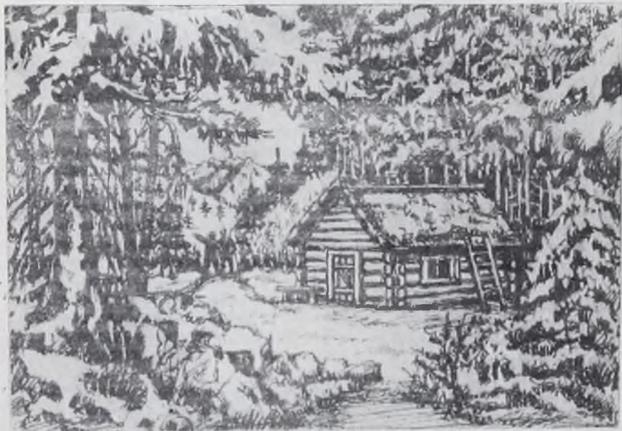
Зимовье близ Большого Колед.