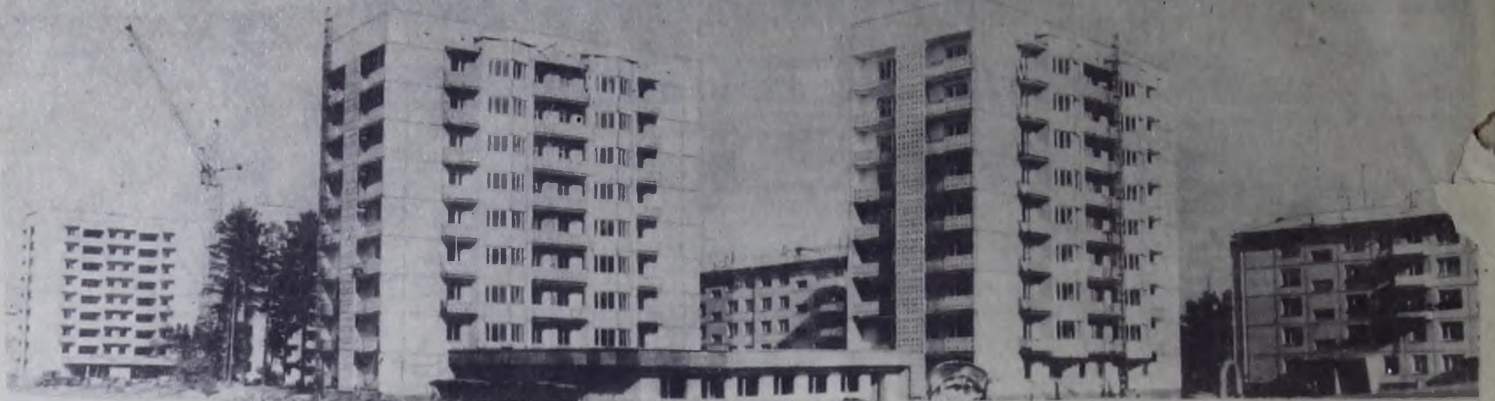
ПАНОРАМА 15а МИКРОРАЙОНА.