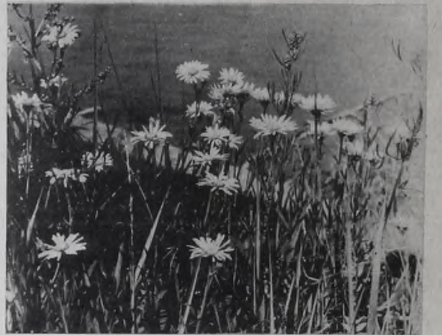
Редактор Т. И. ВИНОГРАДОВА

В ЖИВОПИСНОМ месте, в окружении темных елей и белоствольных берез расположен пионерский лагерь «Космос». 670 девочек и мальчишек отдыхают здесь во втором сезоне.