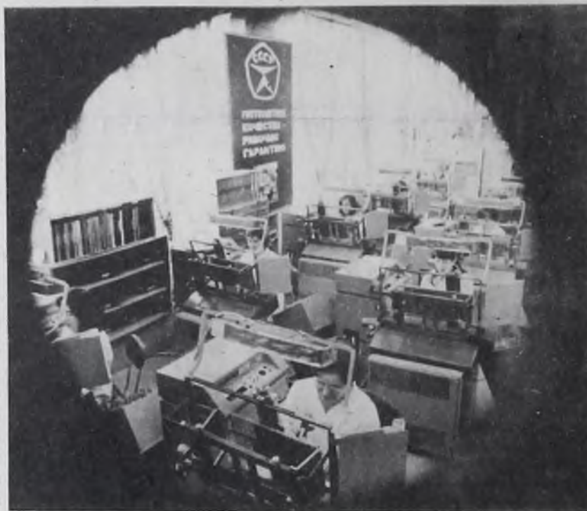
ИДЕТ ХОЛОДНОКАТАНЫЙ НЕРЖАВЕЮЩИЙ ЛИСТ

Основными направлениями экономического и социального развития СССР предусматривается в одиннадцатой пятилетке увеличение производства холоднокатаного стального ли-