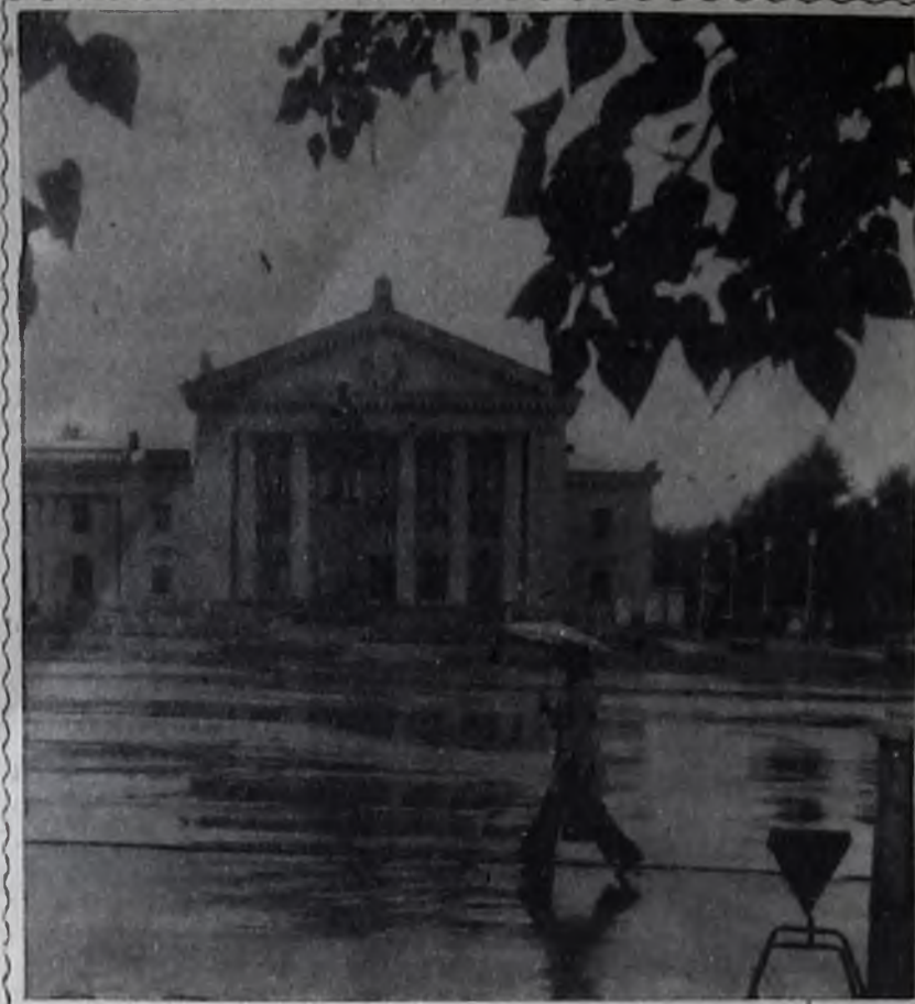
В нашем городе дождь.