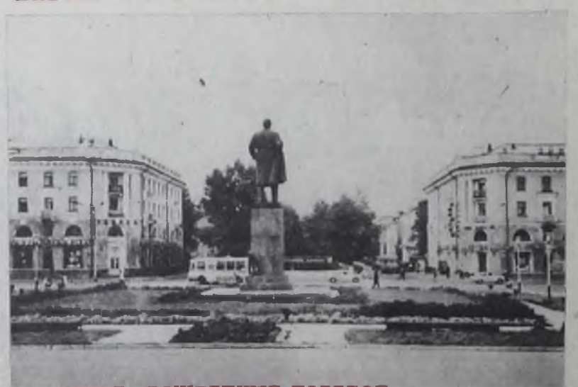
ГОРОД, РОЖДЕННЫЙ ПОВЕДОМ.