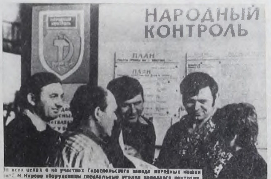
Во всех целях и на участках Горно-областного завода опытных машин М. И. Кирово оборудованы специальные уголки народного контроля.

ПРИУМНОЖАТЬ И ЭФФЕКТИВНО ИСПОЛЬЗОВАТЬ НАРОДНОЕ ДОБРО ВО ИМЯ ДАЛЬНЕЙШЕГО РОСТА ЭКОНОМИКИ СТРАНЫ И ПОВЫШЕНИЯ БЛАГОСОСТОЯНИЯ СОВЕТСКИХ ЛЮДЕЙ.