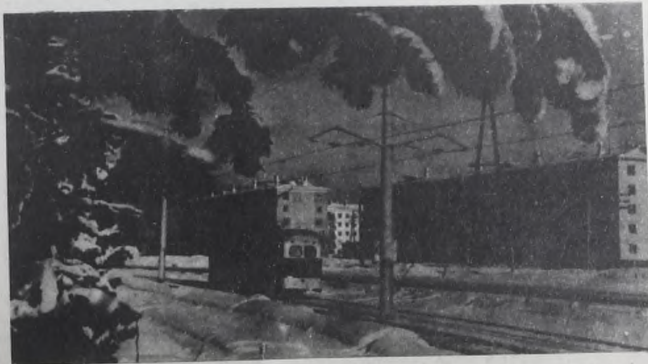
Аягарт. Январский день.

ЗА ТРИ квартала со дня подготовки цеха к присвоению звания «Образцового по научной организации труда и управлению производством» существенно повысились технико-экономические показатели. Без увеличения рабочей силы выполнен объем валовой продукции на 74,1 тысячи рублей больше, чем за сравнимый период 1979 г. Плановое задание по реали-