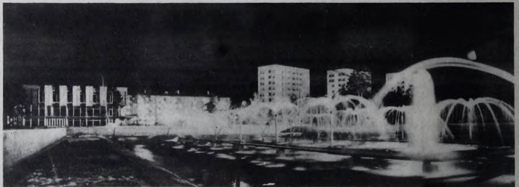
★ ОГНИ АНГАРСКА

А коллектив в этом детсаду подобрался опытный — по итогам третьего квартала ему, как победителю социалистического соревнования, было вручено переходящее Красное знамя отдела детских учреждений.