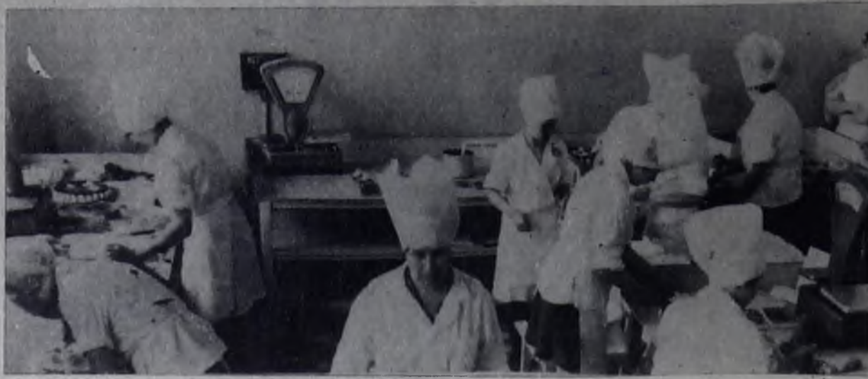
★ Конкурс кондитеров