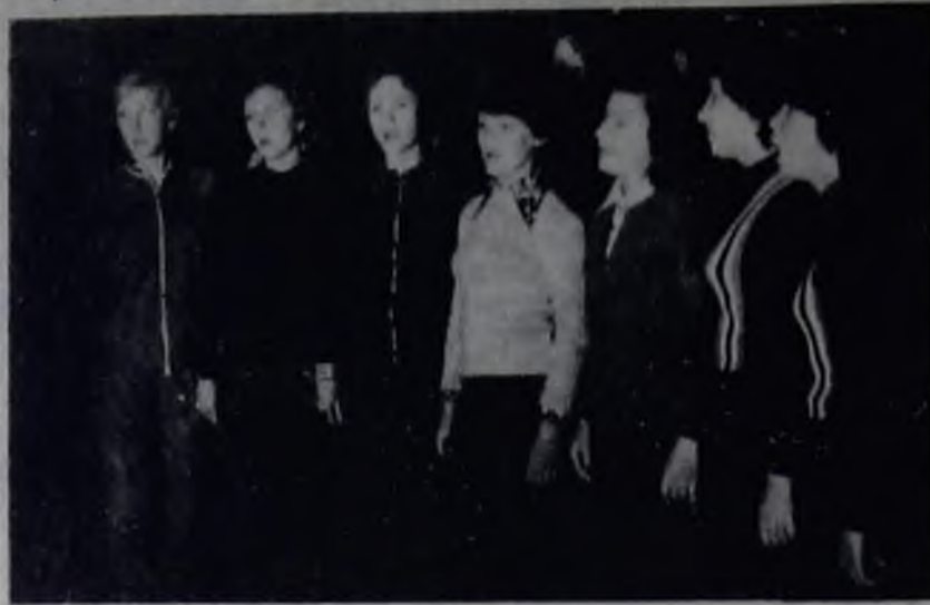
◆ Свою песню девушки из отдела детских учреждений посвящают 30-летию комсомола стройки.

Молодость — прекрасная и плодотворная пора в жизни человечества, поэтому молодежь всегда волновала и обогащала мир.