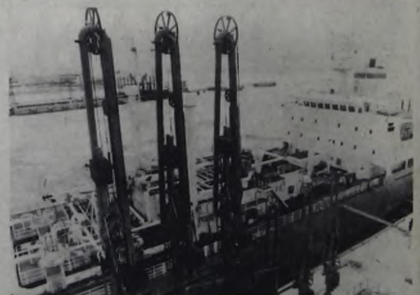
В Латвии действует и продолжает строиться с участием западноевропейских стран и США Вентспилский припортовый завод по транспортировке и переработке химических грузов.