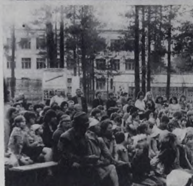
На снимках: 1. В тесноте, да не в обиде. 2. Веселый танец. 3. В течение часа лектор М. В. Прокопьев не «расставался» с микрофоном. 4. Звучит песня в исполнении молодежного ансамбля актвого зала строителей.