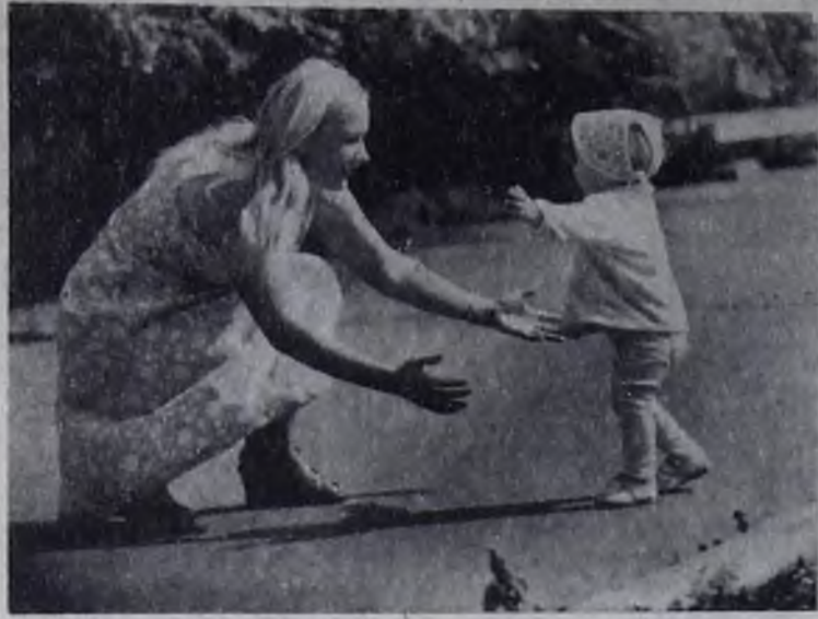
● Материнская нежность.