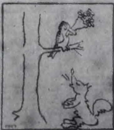
— Сама достала к празднику или снова бог послал!.. Рис. Г. ТРОЩИНСКОГО.

*** Жена мужу: Не понимаю, как можно проводить все вечера в пьяной! — Не понимаю, не понимаю! Зачем же говорить о вещах, которых ты не понимаешь! *** — Хорошая ты у меня. — говорит муж жене. — красивая, умяная, хозяйственная! Будь ты, Марта, чужой женой, тебе бы цены не было! *** — Да дорогой, я клялась перед алтарем всегда поровну делить с тобой горе и радости. Что ж, мы вместе прошли через войну, два наводнения, болезни, пожар, но теперь ты требуешь от меня невозможного! На хоккей я с тобой не пойду! *** Богатый холостяк завещал свое состояние трем женщинам, которые в свое время отвергли его предложение о женитьбе. «Я обязан им миром и счастьем», — написал он в завещании, — которым я наслаждался всю жизнь».