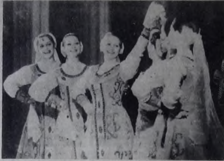
● В танце.