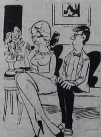
— Дорогой, как мне будет не хватать твоих конфет и твоих цветов, когда я выйду за тебя замуж. «Рир», Франция.

*** Жена мужу: Не понимаю, как можно проводить все вечера в пьяной! — Не понимаю, не понимаю! Зачем же говорить о вещах, которых ты не понимаешь! *** — Хорошая ты у меня. — говорит муж жене. — красивая, умяная, хозяйственная! Будь ты, Марта, чужой женой, тебе бы цены не было! *** — Да дорогой, я клялась перед алтарем всегда поровну делить с тобой горе и радости. Что ж, мы вместе прошли через войну, два наводнения, болезни, пожар, но теперь ты требуешь от меня невозможного! На хоккей я с тобой не пойду! *** Богатый холостяк завещал свое состояние трем женщинам, которые в свое время отвергли его предложение о женитьбе. «Я обязан им миром и счастьем», — написал он в завещании, — которым я наслаждался всю жизнь».