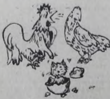
Рис. Е. КАРПОВА.

*** В автомастерскую входит дама и спрашивает у механика: — Ну, так что с моим автомобилем? — Гм... пока могу сказать только одно — ключ и пепельница в полном порядке. *** Два старика вспоминают свою молодость. — Ради меня одна прелестная девушка рисковала своей жизнью, — говорит со вздохом один. — Как это? — Она сказала, что скорее прыгнет в Дунай, чем выйдет за меня замуж.