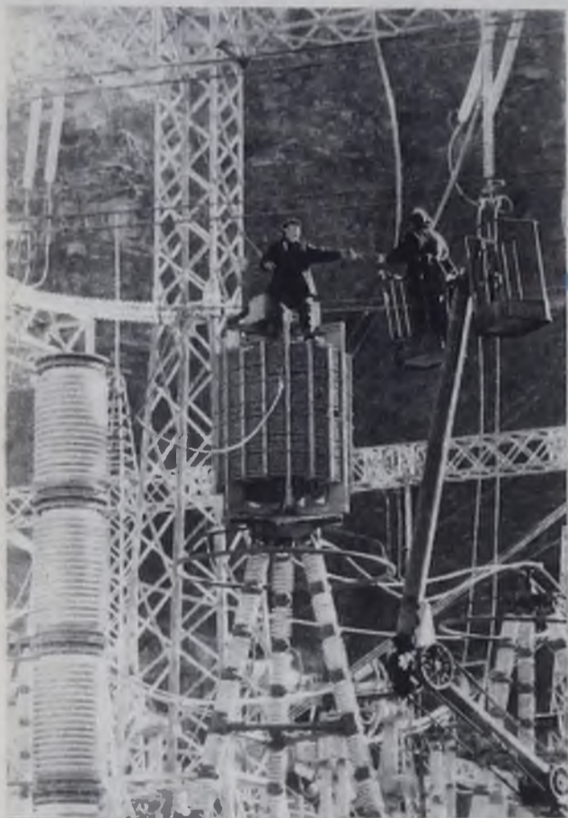
ТАДЖИКСКАЯ ССР. Около 11 миллиардов киловатт-часов электроэнергии выработали с момента пуска шесть агрегатов Нурекской ГЭС. На снимке: монтаж открытого распределительного устройства ОРУ-500.