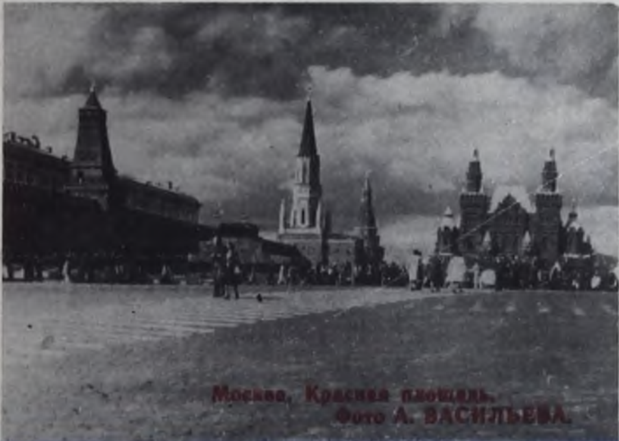
Москва, Красная площадь.