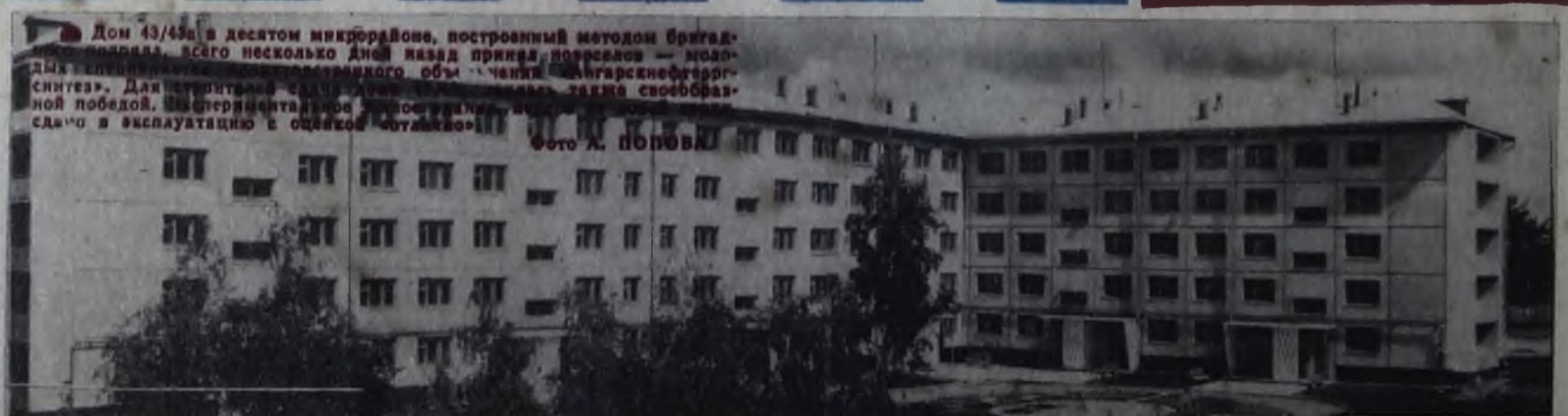
Дом 43/43а в десятом микрорайоне, построенный методом бригадного подряда, всего несколько дней назад принял посетителей — монтажников комплексного объекта «Ангарскнефтеоргсинтез». Для строительства этого объекта была создана специальная бригада, которая работает по методу бригадного подряда.