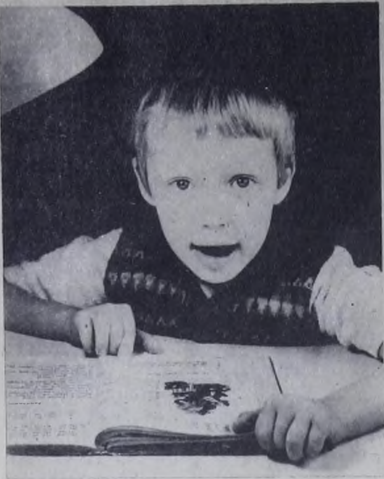
✦ Прощай, букварь! Здравствуйте, первые каникулы!