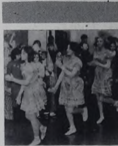
на сцене актового зала, на агитплощадках и в пионерских лагерях, на пусковых объектах — самодеятельные артисты с большим желанием ищут зрителей, находят их, а с ними — и признание.

С танцорами актового зала знакомы многие зрители. Концерты в СМУ-5, в ГПТУ-12,