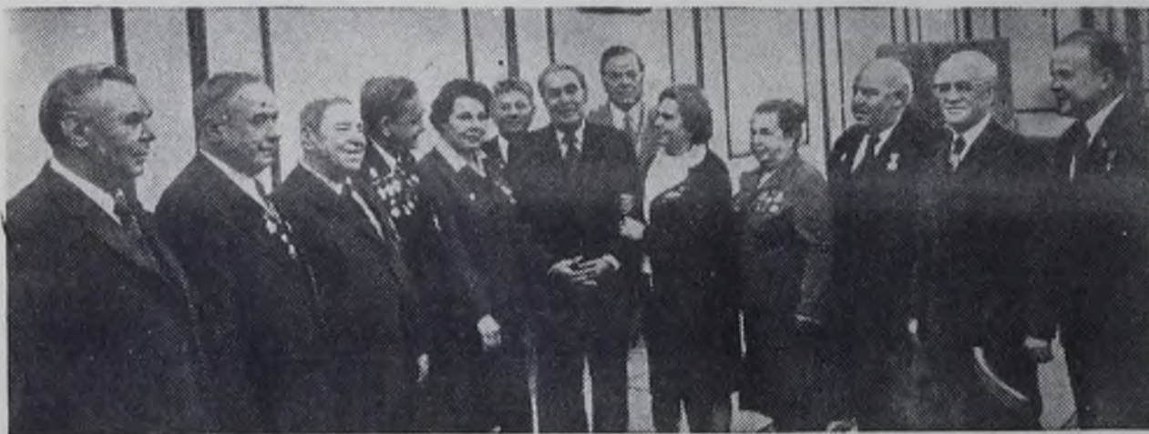
Москва. Сентябрь 1975 года. Генеральный секретарь ЦК КПСС Л. И. Брежнев принимает в Кремле группу зачинателей стахановского движения.