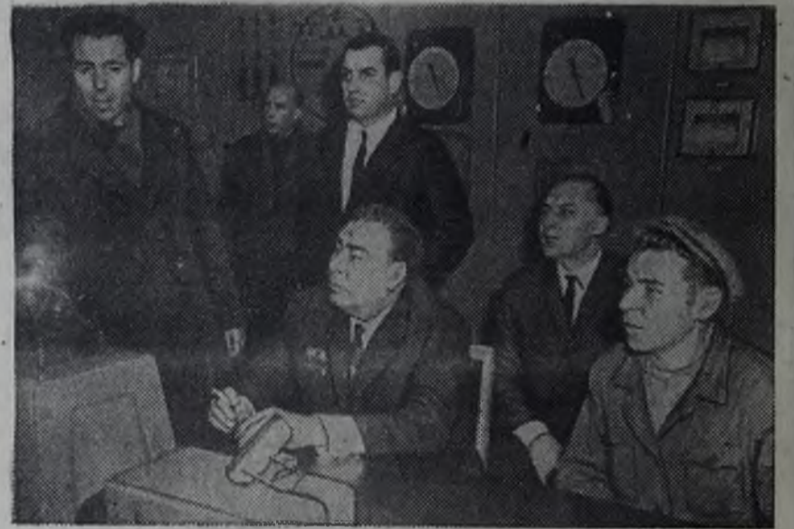
Жданов. Январь 1967 года. Генеральный секретарь ЦК КПСС Леонид Ильич Брежнев на Ждановском металлургическом заводе имени Ильича.