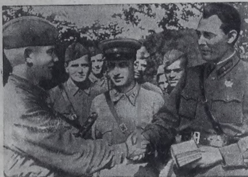
Сентябрь 1942 года, время боев за Туапсе. Бригадный комиссар Л. И. Брежнев беседует с солдатами. Только что он вручил одному из них — Александру Малову — партийный билет.