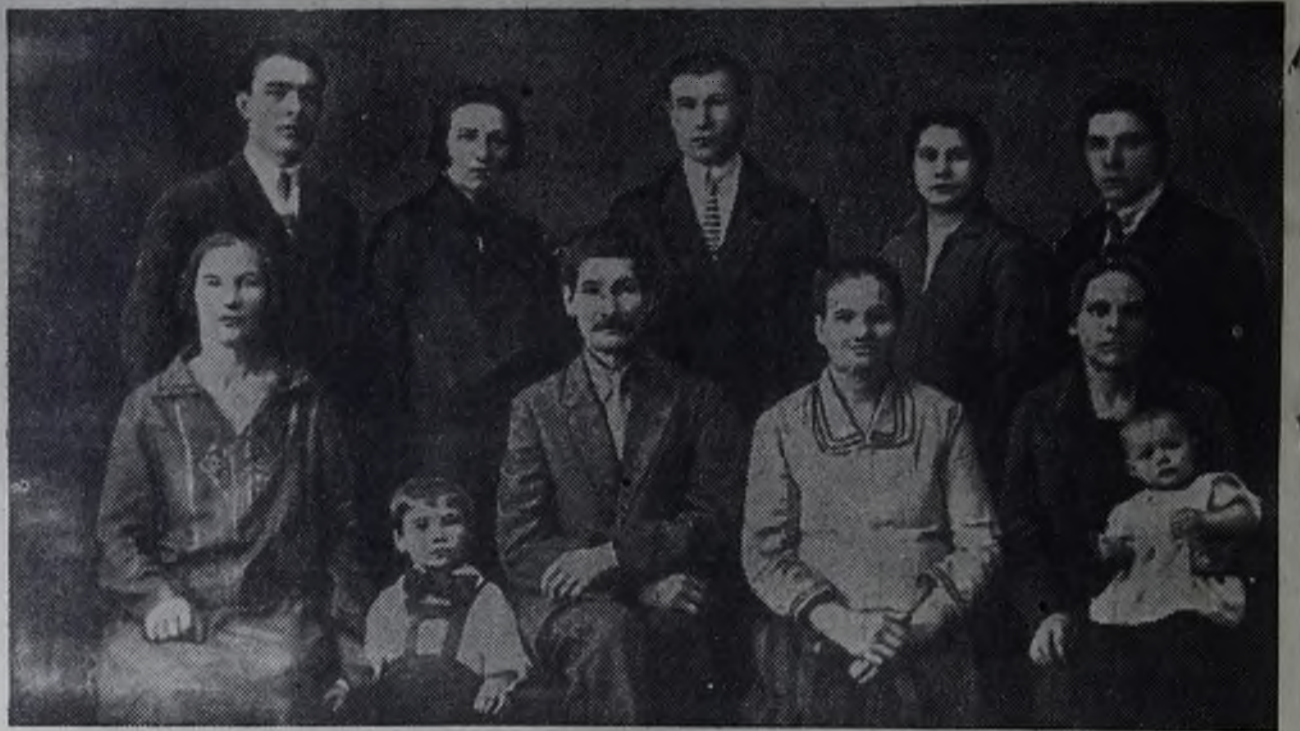
Днепродзержинск. Семья Брежневых. Л. И. Брежнев в верхнем ряду слева.

На снимке: на трибуне — Генеральный секретарь ЦК КПСС Л. И. Брежнев.