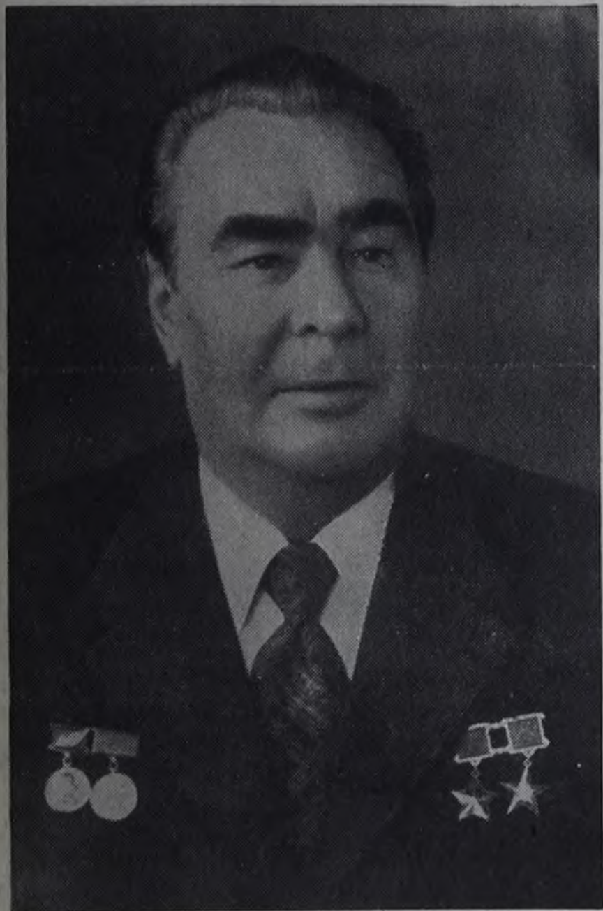
Генеральный секретарь ЦК КПСС товарищ Л. И. Брежнев.