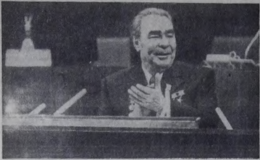
Москва. 24 февраля 1976 года. Открытие XXV съезда Коммунистической партии Советского Союза.

● Окончание. Начало фотоочерка на 1-й стр.