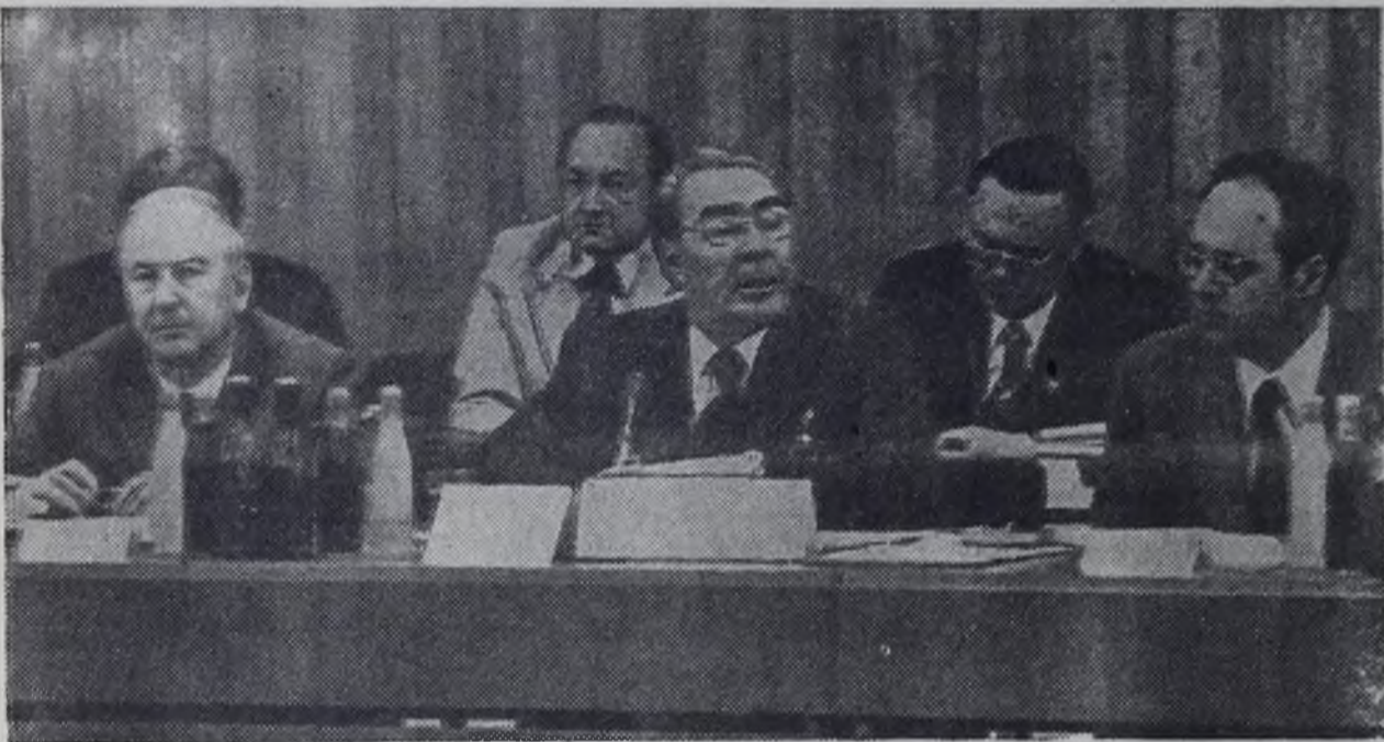
Берлин. Июнь 1976 года. Конференция коммунистических и рабочих партий Европы. С речью выступает глава делегации КПСС, Генеральный секретарь ЦК КПСС товарищ Л. И. Брежнев.