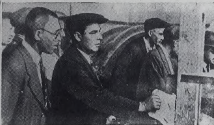
Запорожье. 1947 год. Л. И. Брежнев (в центре) в период восстановительных работ на заводе «Запорожсталь».