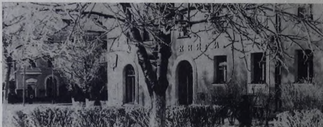
Город в белом наряде.

Г. ПОЛВАРИН, судья республиканской категории, мастер спорта СССР.