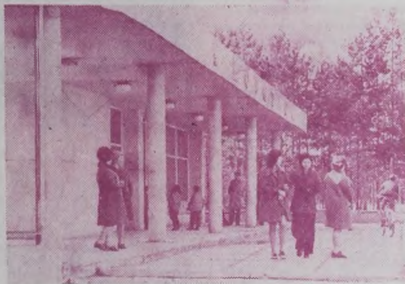
На снимках: новые магазины и кафе — ежегодные приметы г. Ангарска.

Из года в год улучшаются социально-бытовые условия строителей. И в то же время еще имеется значительная потребность в жилье, детских дошкольных учреждениях. На 1 января