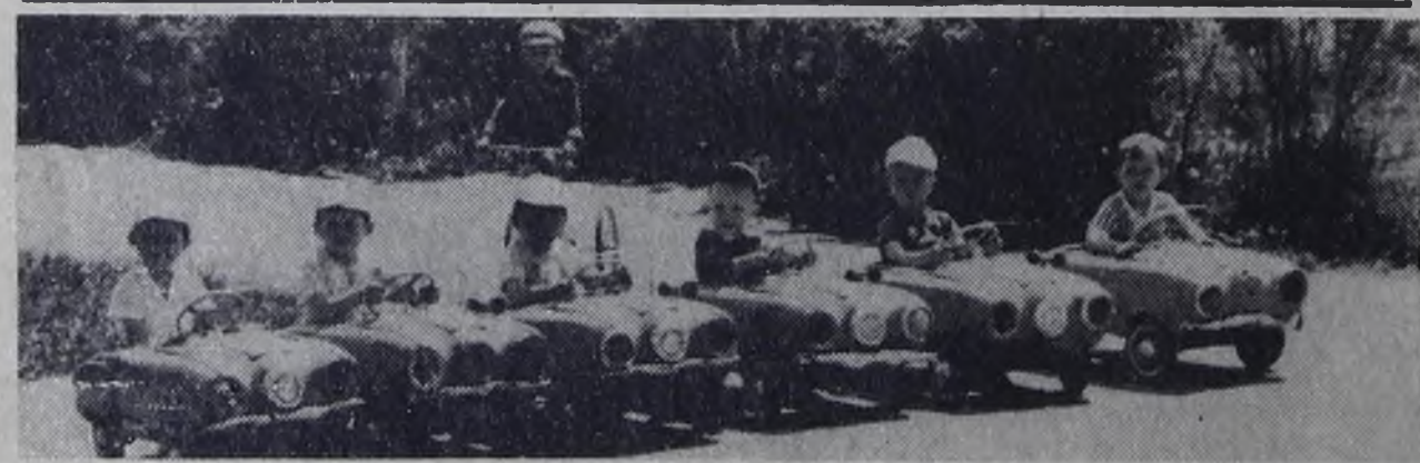
ВОСКРЕСНЫЙ ДЕНЬ В ПАРКЕ. АВТОГОШНИКИ НА СТАРТЕ.