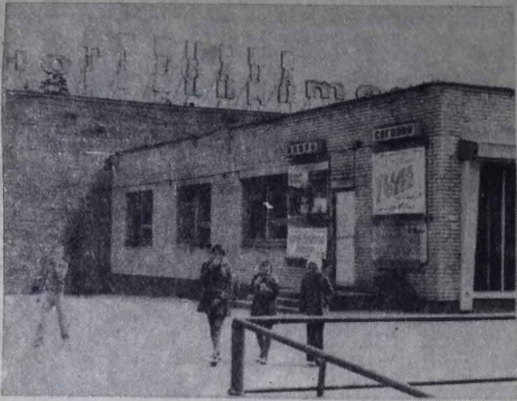
СДЕЛАНО РУКАМИ СТРОИТЕЛЕЙ. КИНОТЕАТР «ГРЕНАДА» В 12 МИКРОРАЙОНЕ.