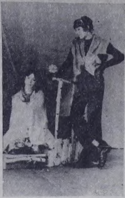
Сцена из спектакля актового зала «Чертова мельница».

Уходят из распахнутых ворот, На трубный зов дорог спешат мужчины Среди меридианов и широт Искать свои Особые вершины. Мужчинам нужен Риска холодок. Они летят среди погод нелетных. Необходимо, Как воды глоток, Им опьянение побед нелегких. И светится, как звездочка,окно, С дороги кто-то ждущих глаз Не сводит. Но у мужчин Уж так заведено: Они всегда куда-нибудь уходят. И было так. И вечно будет впредь! Но, женщины, Поймите без кручины: Им надо что-то там преодолеть, Чтобы себя почувствовать Мужчиной.