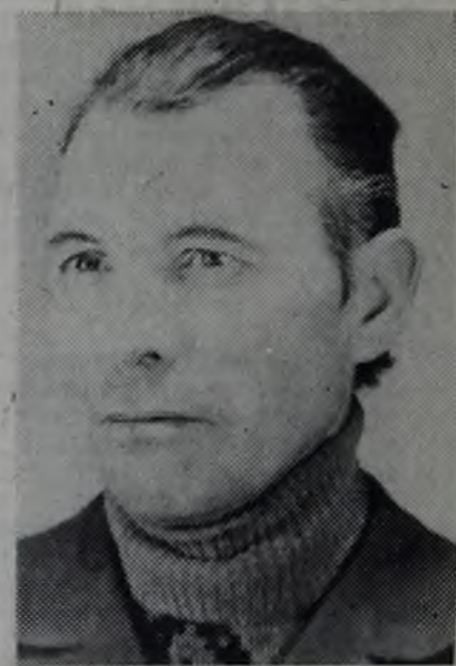
БРИГАДИР ПЕРЕДОВОГО КОЛЛЕКТИВА

В целом же о выполнении заданий рапортовали десятки бригад и экипажей.