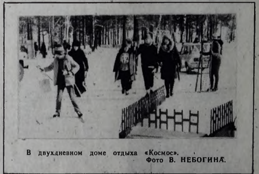
В двухдневном доме отдыха «Космос».