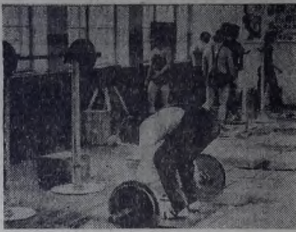
В спортивном зале подшефной школы № 7 идут занятия секции тяжелоатлетов треста «Зимахмстрой».