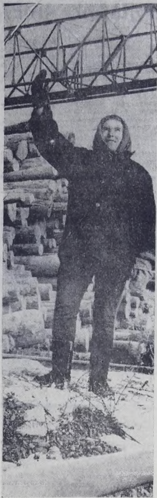
одна забота прибавилась бригадире — в бригаду пришла молодежь, учить нужно, настаивать.