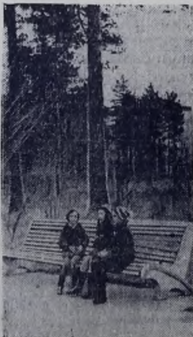
В ПАРКЕ СТРОИТЕЛЕЙ. Фотоэтиюд В. НЕБОГИНА.