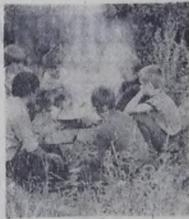
Лето в нашем краю.