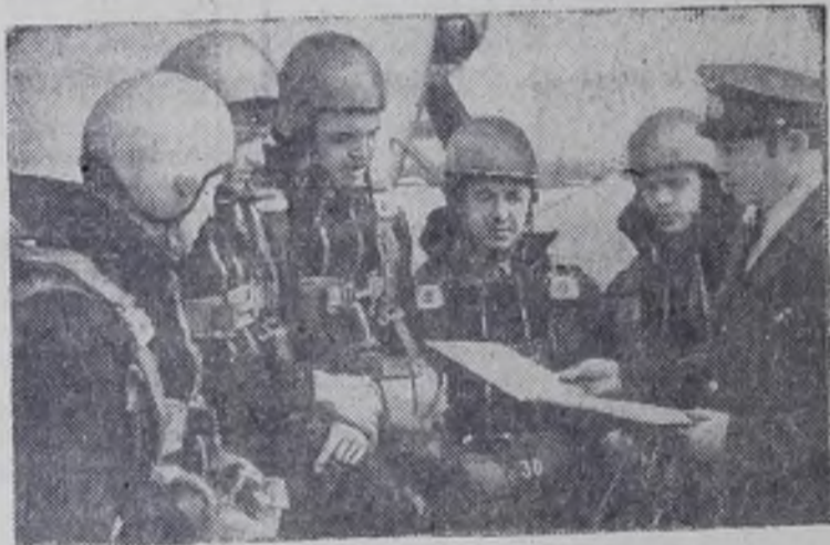
Круглосуточно патрулируют самолеты и вертолеты Западно-Уральской авиационной базы охраны лесов Министерства лесного хозяйства РСФСР, под наблюдением которой находятся зеленые массивы пяти областей и трех автономных республик, расположенных в бассейне рек Камы и Волги.

В нынешнее жаркое, засушливое лето небесные патрули, на вооружении которых совершенная современная техника, ликвидировали свыше тысячи очагов пожаров.