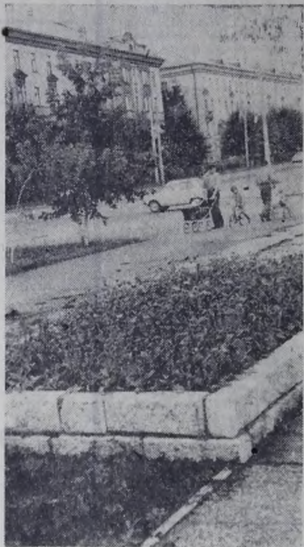
Ангарск в августе.

врач кабинета инфекционных болезней поликлиники стройки.