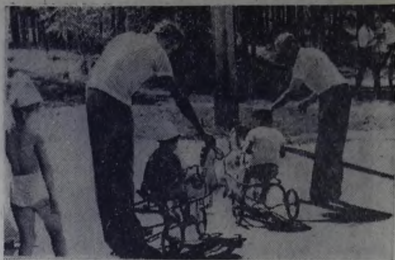
В парке строителей в выходной день.

Н. ПОЗДНЯКОВА, наш внештатный корреспондент.