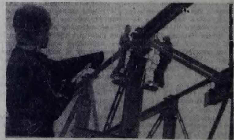
На снимке: монтаж остакды 15а ведут молодые рабочие бригады Н. Капленко из СМУ-42.