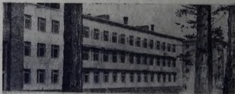
Профилакторий 208 квартала. Здесь строители заканчивают работы.