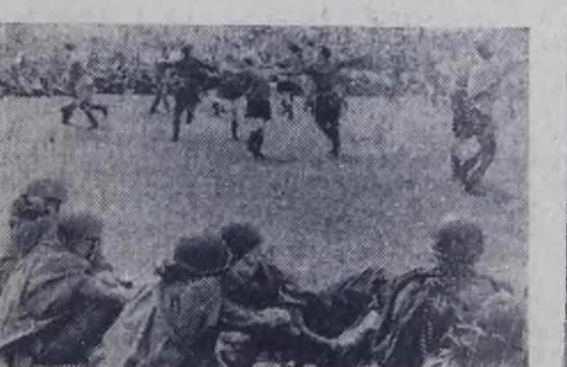
НА СНИМКАХ: возложение венков к памятнику В. И. Ленина; выступают участники художественной самодеятельности.