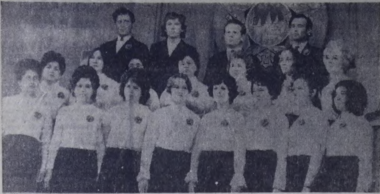
Концерт коллектива художественной самодеятельности завода ЖБИ-3 на смотре начатся литературно-драматической композицией. Жюри оценило ее оценкой «отлично». На снимке: участники композиции.