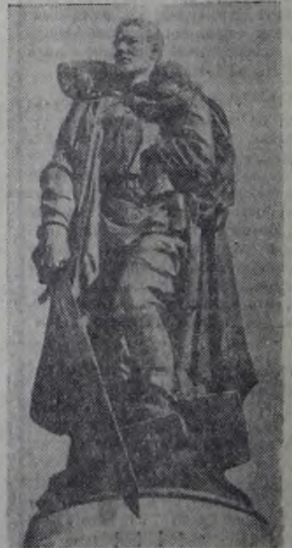
ГДР. БЕРЛИН. Памятник советским воинам в Трентов-парке. На снимке: центральная фигура ансамбля.