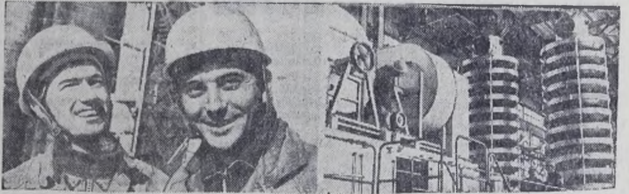
ТУЛЬСКАЯ ОБЛАСТЬ. На Ефремовском заводе синтетического каучука сооружается вторая очередь производства каучука марки СКД.

В цехах монтируется оборудование. С вводом его в строй выпуск каучука увеличится вдвое.