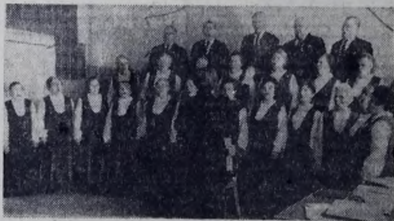
Поет хор ветеранов труда и революции «Красная гвоздика». Актный зал строителей.

Уйдет рассветная полоска, босой по травам за кордон. И протрубит труба горниста «зарю» солдатского утра... Неужто здешняя граница ограничение добра? И пусть тебе в такое утро напоминаем обо мне послужит просто ветка клена в твоем кувшине на окне.