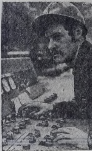
Полным ходом идет монтаж оборудования второй очереди Челябинского завода профилированного стального настила.

Так же поделовому начала бригада и завершающий год девятой пятилетки. И верится, что монтажники не уступят завоеванных высоких рубежей. С. ВЕРЕЦАГИНА.