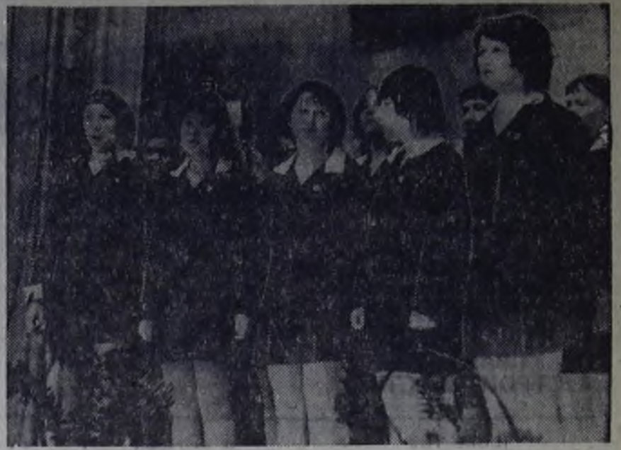
Этот снимок группы учащихся из ГПУ-12 наш штатный фотокорреспондент В. Небогин сделал на вечере профориентации в актовом зале строителей. Девушки рассказывают, почему они выбрали профессию строителя.