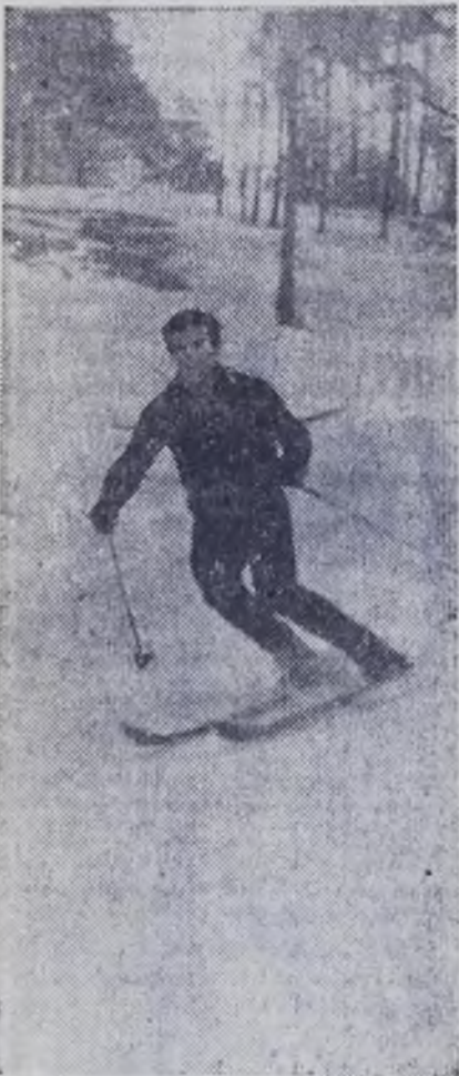
На лыжне.

Бабка вслепую вязала — Таял катучий клубок. Астра в кувшинчике вяла. Дождик за стеклами тек. Этими вот пустяками Втянут в забывчивый лад, Я, будто тонущий камень В море, где странники спят.