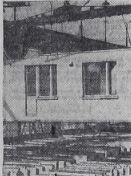
МОСКВА. В цехах домостроительного комбината № 3 впервые в нашей стране в масштабах производства осваивается нанесение кремнеорганических эмалей на фасадные строительные конструкции.

МСУ-8 гоже провалило все основные показатели — план СМР, кладку монолитного бетона, монтаж сборного железобетона и кирпичную кладку, а также не сдало под монтаж электрооборудование ТП в районе котельной. МСУ-11 не выполнило хозяйственным способом СМР, а также земляные работы, кирпичную кладку, монолитный и сборный железобетон, панели, не смонтировало второй этаж жилого дома № 5 в 6 микрорайоне Ново-Ленино и др.