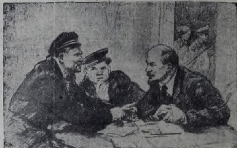
«Вести с фронта».

ОСНОВАТЕЛЬНО ПОТРЕПАННЫЕ Кубанский, Дон-