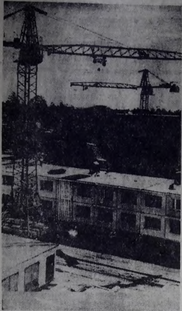
Ангарск. Строительство в микрорайоне 6а.