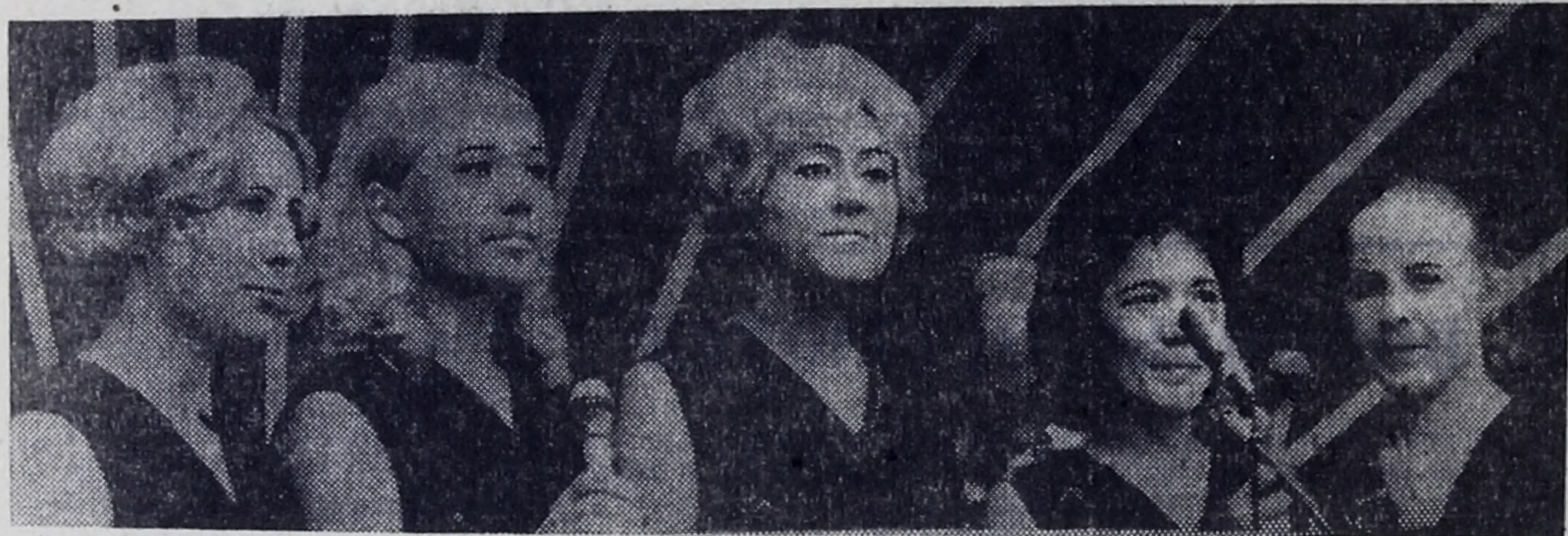
Поют девушки из народного ансамбля «Ангара» при актовом зале строителей.