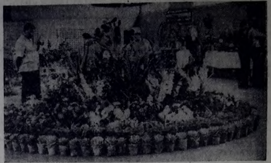
Это было удивительное по красоте зрелище — радужные переливы зелени и цветов, искусство природы и человека. В конце августа состоялась городская выставка «Дары природы», на которой были представлены экспонаты и коллектива тепличного хозяй-

О. БЕСПАЛЬЧУК, член центральной комиссии по комплексу ГТО.