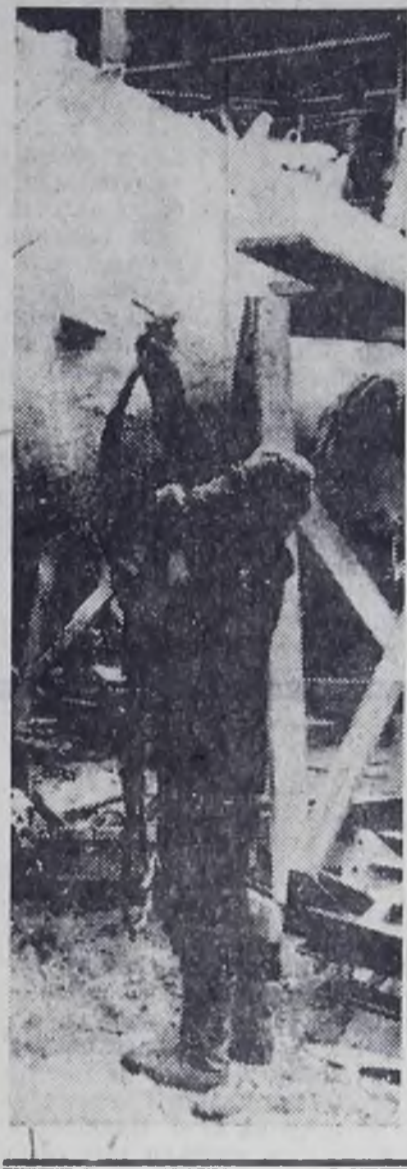
Комплекс этилена-пропилена. Илет изолировка колонн химическим способом.

тификационные колонны, первый срок ввода установки в действие был бы выдержан.